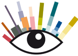
Foto-, filmopdracht, multimediale productie Verhalen van Harculo voor professionele fotografen / beeldmakers

Stichting De Stad Verbeeldt nodigt professionele fotografen, filmers en multimediale producenten uit om hun zienswijze kenbaar te maken inzake de beeldopdracht 'Verhalen van Harculo'. Stichting 'De Stad Verbeeldt' nodigt hen uit een voorstel in te dienen, opgezet als 1/ concept en visualisatie en 2/ een plan van aanpak c.q. uitvoering.